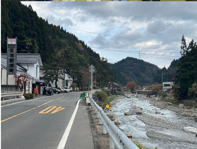
(8月の台風7号の爪痕はまだ残っており、佐治川にかかる橋は一部崩落したままでした)