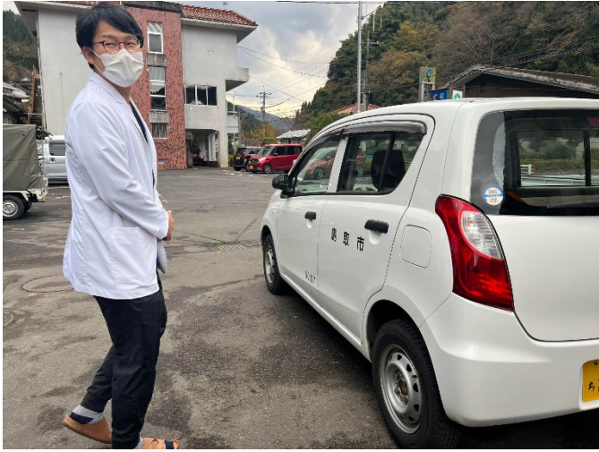
(鳥取市の公用車で、訪問診療に出発！)