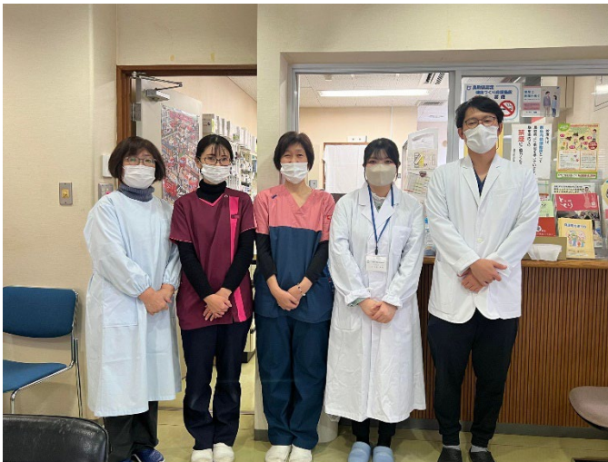
(診療所のみなさん、ありがとうございました。)