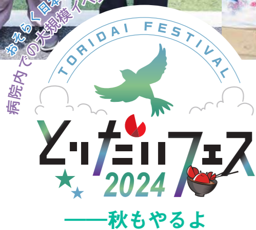
取材・文 中原 由依子

2024年6月16日。とりだい病院外来棟1階を中心とした一帯で「とりだいフェス2024」が初開催された。病院をみんなの遊び場にしようというかけ声で、とりだい病院の医療を知ってもらおうことを柱とし、キッズディスコ、足湯、音楽、キッチンカーとエンタメ盛りだくさんで行われた。この前代未聞のイベントに約4000人もの人々が詰めかけた（遠くは東京から!!）。笑顔と熱気に包まれた「とりだいフェス2024」を写真とともに振り返る。