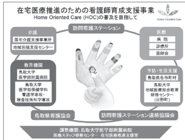
在宅医療推進のための看護師育成支援事業の概念図

広報活動では、本事業の情報発信としてホームページの更新を行いました。また、鳥取県訪問看護ステーション連絡協議会のご協力によりセミナー等の広報も行うことができました。