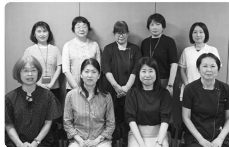
上半期 T-HOC支援室スタッフ一同