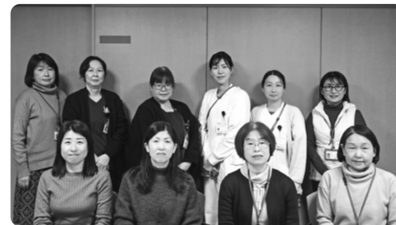
下半期 T-HOC支援室スタッフ一同